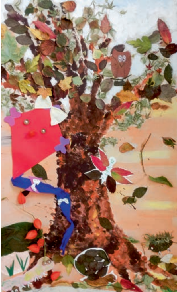
Das Gestalten des Gemeinschaftsbildes war eine von vielen Aktionen des Herbstfestes.

Auch wurde ein großes Gemeinschaftsbild erstellt, an dem die Bewohner aktiv mitgewirkt haben. Entweder klebten sie die im Vorfeld gesammelten und gepressten Herbstblätter auf, tupften Farbe auf das Bild, oder klebten kleine Kunstwerke aus Naturmaterialien auf.